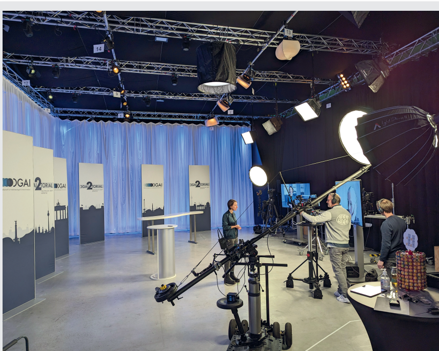
Vier Tage lang wurde aus dem Berliner Studio von Lux AV das DGAi2TORIAL gesendet. Knapp 50 Expertinnen und Experten vermittelten dabei alles Wissenswerte über die Fachbereiche Intensiv-, Schmerz- und Palliativmedizin.